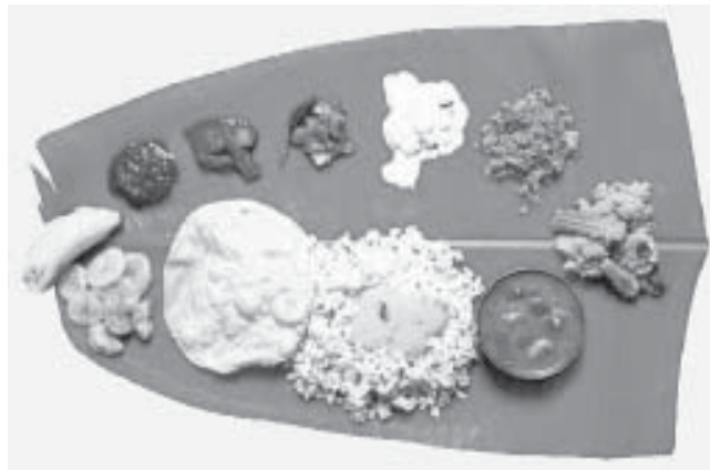
ആഹാരകാര്യങ്ങളിൽ അളവിനുമുണ്ട് ഏറെ പ്രാധാന്യം. അതാതു സമയത്ത് ഓരോരുത്തരുടെയും ആവശ്യമനുസരിച്ച് വേണ്ട അളവിൽ കഴിക്കണം.

ഇതൊന്നും ശ്രദ്ധിക്കാതെ തിരക്കുപിടിച്ചു ഭക്ഷിക്കുമ്പോഴോ? ദഹനം ആകെ തകരാറിലാകും. ഗ്യാസ്ത്രബിൾ, മലബന്ധം, വയറുവേദന എന്നിവയ്ക്കും ഇതു കാരണമാകും. പിന്നീട് വളരെ ഗുരുതരമായ രോഗങ്ങളുണ്ടാകാനും സാദ്ധ്യതയുണ്ട്. അതുകൊണ്ട് വേഗത്തിൽ ഭക്ഷണം കഴിക്കുന്ന ശീലം ഉപേക്ഷി