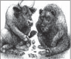
BULL & BEAR

ആഗോള വിപണിയിലെ അനുകൂലചലനങ്ങളുടെ കൂട്ടിപ്പിരിയ്ക്കൽ ഇന്ത്യൻ ഓഹരി സൂചിക രണ്ട് വർഷത്തിനിടയിലെ ഏറ്റവും ഉയർന്ന നിലവാരത്തിലേക്ക് ചുവടുവെക്കുകയാണ്. കാപ്പിറ്റൽ ഗുഡ്സ്, ബാങ്കിംഗ്, റിയൽ എസ്റ്റേറ്റ്, സിമന്റ്, ടെലികോം തുടങ്ങിയ മേഖലകളിലെ ഓഹരികളിലുണ്ടായ നിക്ഷേപ താല്പര്യമാണ് വിപണിക്ക് ഗുണമായത്. 2008 ഫെബ്രുവരി 15 ന് ശേഷം ഇതരദൃശ്യമാണ് ദേശീയ സൂചിക ഇത്രയും ഉയർന്നതിരക്കിൽ എത്തിനിൽക്കുന്നത്.