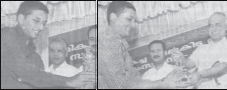
ചെറുകിടവ്യവസായ രംഗത്ത് മികച്ച പ്രകടനം കാഴ്ചവെച്ച സംരംഭകർക്കുള്ള സംസ്ഥാന-ജില്ലാ തല അവാർഡ് മിഡാസിന് വ്യവസായ മന്ത്രി എളമരം കരീം സമ്മാനിക്കുന്നു.