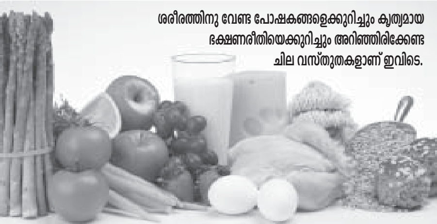
ശരീരത്തിനു വേണ്ട പോഷകങ്ങളെക്കുറിച്ചും കൃത്യമായ ഭക്ഷണരീതിയെക്കുറിച്ചും അറിഞ്ഞിരിക്കേണ്ട ചില വസ്തുതകളാണ് ഇവിടെ.

രാത്രി മിതമായ ഭക്ഷണമാണ് വേണ്ടത്. ചുടുള്ള പാൽ കുടിക്കുന്നത് ഉറക്കം കിട്ടാൻ നല്ലതാണ്. മലബന്ധം ഒഴിവാക്കാൻ ധാരാളം വെള്ളവും കുടിക്കണം. മോർ പഴച്ചാർ, സൂപ്പ് എന്നിവ ഭക്ഷണത്തിൽ കൂടുതൽ ഉൾപ്പെടുത്തുന്നതും നന്ന്.